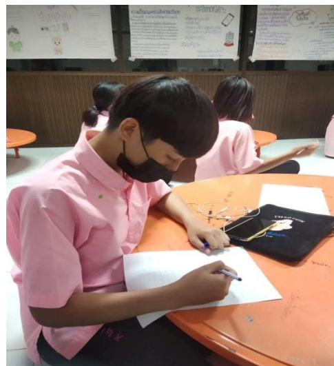
ภาพที่ 2 และ ภาพที่ 3 นักเรียนทำแบบสอบถาม